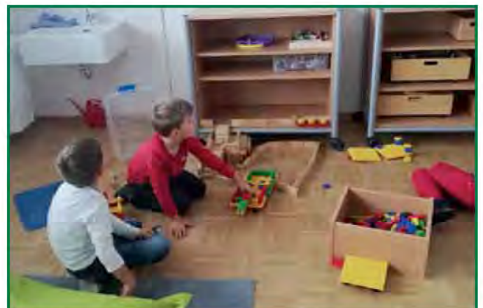
Malerei und Spieleinheit an der Ganztageschule