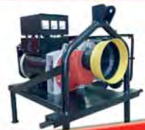
Zapfwellenaggregate für Traktorenbetrieb

Aktion z.B. 27 kVA, 230/400V mit AVR-Regelung f. Traktorbetrieb € 2.690,- Preis inklusive 20% MwSt.