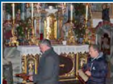
Der alte Brauch „das Einspinnen des Hochaltars“ vor der hl. Messe

Die Festlichkeiten werden durch den MGV Tratten gesanglich umrahmt: Zum Abschluss gibt es eine Agape. Die Bevölkerung ist zu diesen Festlichkeiten herzlich eingeladen.