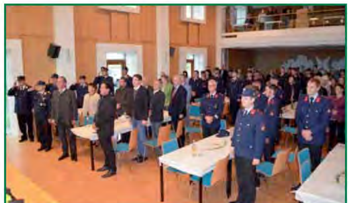
FeuerwehrkameradInnen, Exekutive, Politik und Wegbegleiter fanden sich zum Jubiläum ein