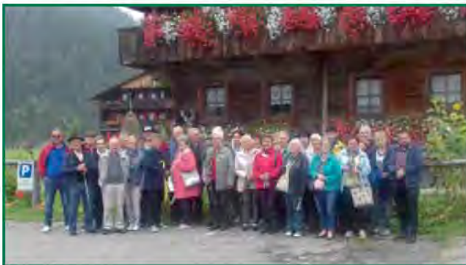
Beim Herbstausflug nach Südtirol machten wir einen Halt in Sappada

Der Herbstausflug führte uns dieses Jahr nach Südtirol. Gleich bei unserem Ziel hatten wir die Gelegenheit, in Innichen den bedeutendsten Sakralbau der Romanik im Ostalpenraum zu besichtigen. Besonders das romanische Kuppelfresko, die Krypta und