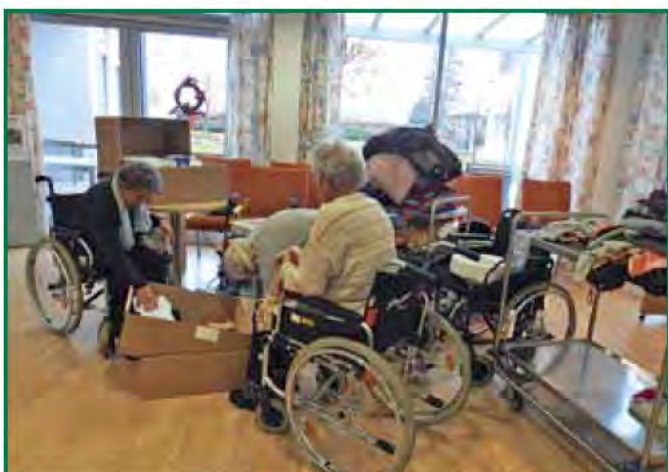
Die Damen helfen mit viel Freude beim Packen mit

Text: Ellen Rettenbacher