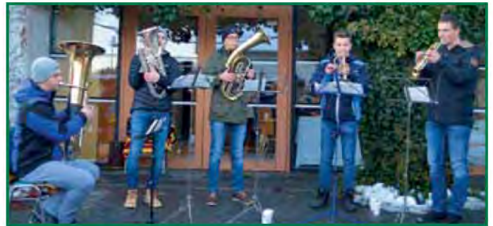
Das Bläserensemble spielte besinnliche Weisen