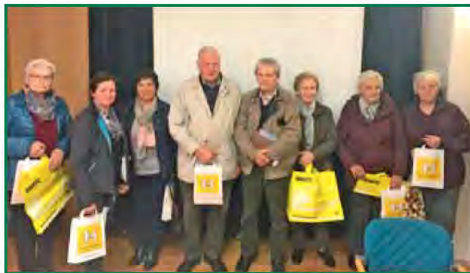
Präventionsvortrag im Kultur- und Gemeindezentrum – ein wichtiger Beitrag zur Sicherheit der Bevölkerung

Zahlreiche PensionistInnen fanden sich im Gemeindezentrum zusammen, um mehr über die gängigsten Betrugsformen zu erfahren. Neben dem Neffentrick gibt es noch weitere Versuche, um einem Opfer Geld zu entlocken, wie beispielsweise mit der Vortäuschung eines Lottogewinns, als (Treibstoff)Bettler oder durch Ablöse von eigenem Gold und Schmuck weit unter dem Marktwert. Im Falle von Betroffenheit bei Betrugsver-