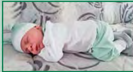
Ben Urbanz - Edling Eltern: Simone Urbanz und Klaus Koschier