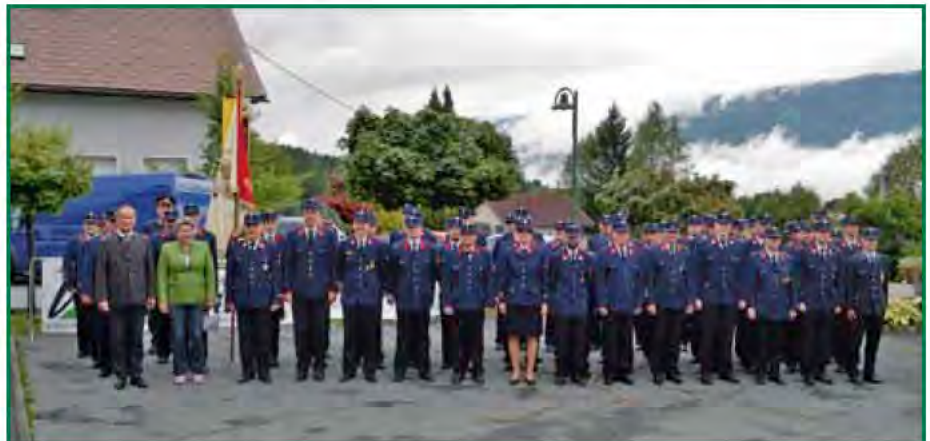
„Gott zur Ehr – dem nächsten zur Wehr“: Der Marsch führte die FeuerwehrkameradInnen sowie die Festgäste von der Kirche durch den Ort zur Veranstaltungsstätte des Kultur- und Gemeindezentrums St. Stefan

Zu Beginn – wie die Chronik berichtet – war die Brandbekämpfung zumeist die Hauptaufgabe der Feuerwehr. Die Ausrüstung hat sich stark verbessert, die Motorisierung Einzug gehalten. Dank der ständigen Aus- und Weiterbildung sind die KameradInnen bestens vorbereitet, um auch die neuen Herausforderungen wie Hochwasser und Sturm bewältigen