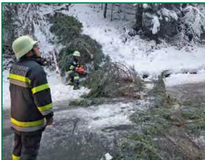
Schneebruch L33 zwischen Matschiedl und Windische Höhe