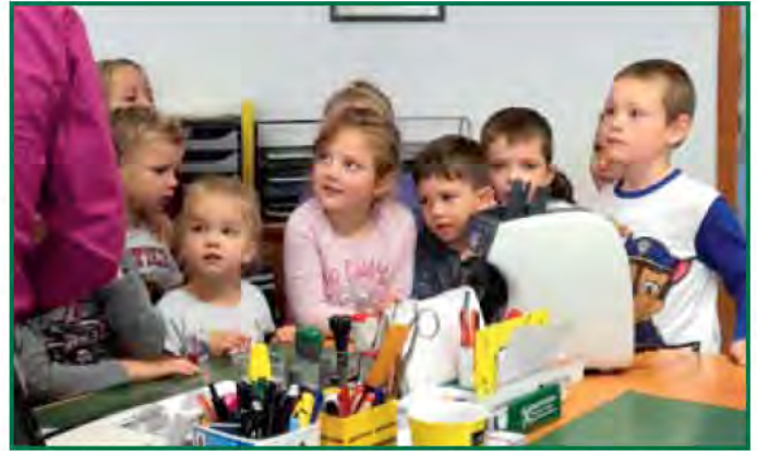
Im Zuge der Weltsparwoche besuchten wir mit allen Kindern die Raiffeisenbank St. Stefan und bekamen eine Führung. Tolle Geschenke und ein Luftballon warteten auf die stolzen Besitzer.