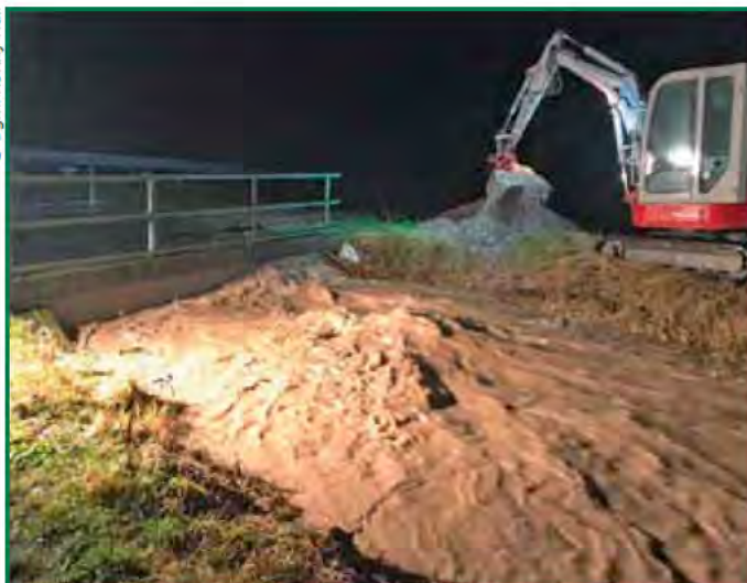
Baggerarbeiten in Bodenhof – Bereich Lipschitzbach

muss, Bonuszahlungen erhalten. Solche Großschadenseinsätze gab es im Sommer und im Herbst 2019 in unserer Gemeinde nicht. Aber wir wurden zu einigen Verkehrsunfällen und Wespeneinsätzen gerufen. Dabei gab es Gott sei Dank keine verletzten Personen und Kameraden. Weiters mussten Pumparbeiten im Bereich Pörschach und ein Schneebruch im Bereich der