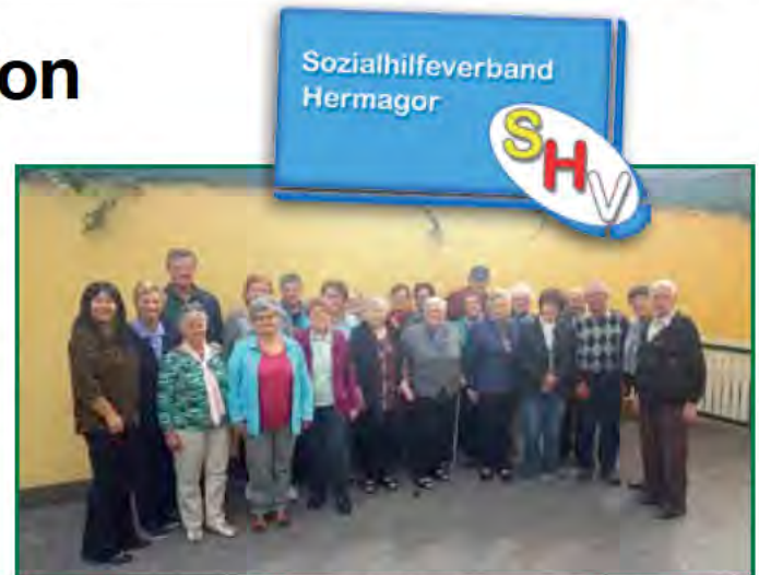
Die TeilnehmerInnen aus St. Stefan fühlten sich im Gasthaus Torwirt in Lavamünd sehr gut aufgehoben

Die Seniorenerholung ist nur ein Teil der Bemühungen auf Bezirksebene, um für unsere