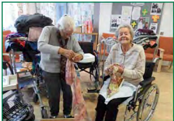
Jeder kann Jedem irgendwie helfen