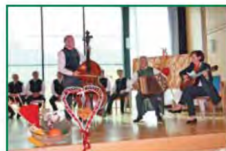
Die Sandbodenmusi aus dem Gurktal spielte flotte Weisen