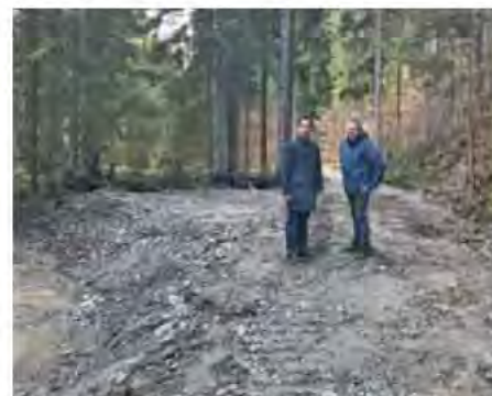
Bürgermeister Rull machte sich vor Ort ein Bild der Unwetterschäden im Bereich des Lipschitzbaches

gangenen Jahren zahlreiche Unwetterkatastrophen bewältigen. Durch den Klimawandel werden wir auch in Zukunft vermehrt mit verschiedenen Unwetterszenarien in immer kürzer werdenden Abständen rechnen müssen. In unserer Gemeinde sind die Sanierungen des letztjährigen Hochwasserereignisses noch nicht zur Gänze abgeschlossen. Fast exakt ein Jahr später verzeichneten wir in der Gemeinde neuerliche Schäden durch Überflutungen und Murenabgänge.