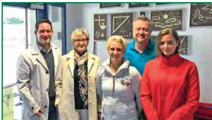
Die Feuerwehren der Gemeinde führen eine jährliche Räumungsübung des Bildungszentrums durch. Bürgermeister Rull überzeugte sich von der reibungslosen Zusammenarbeit von Feuerwehr, Volksschule, Ganztageschule sowie Kindergarten