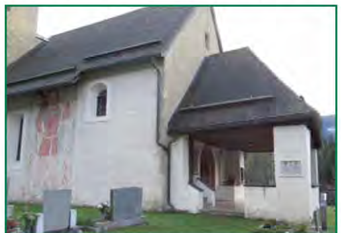
Der Pfarrgemeinderat und die Bauabteilung der Diözese bemühen sich um einen barrierefreien Zugang an der Nordseite der Pfarrkirche St. Paul