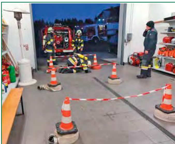
ÖFAST – Übung im Feuerwehrhaus St. Paul

Apropos Urlaub nehmen und Feuerwehrkameraden als Arbeitnehmer. Hier gibt es intensive Verhandlungen mit der Regierung, um für Arbeitgeber im privaten Dienst ein Bonussystem zu erstellen. Dies beinhaltet die Freistellung von Arbeitnehmern bei einem Großschadensereignis. Definiert wurde dieses Großschadensereignis folgend: Ein Einsatz mit mindestens 100 freiwilligen Helfern bei einer Mindestdauer von acht Stunden. Bis jetzt konnten dies nur Arbeitnehmer im öffentlichen Dienst wahrnehmen. Die genaue Gesetzesnovelle muss jedoch erst beschlossen werden. Die Verhandlungen sind jedoch auf einem guten Weg. Dabei soll der private Arbeitgeber bei einem Ereignis, wo der Arbeitnehmer zum Einsatz ausrücken