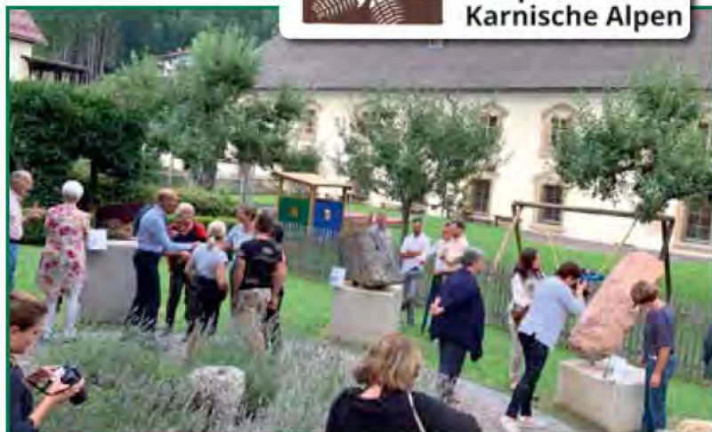
Reges Interesse bei der Eröffnung des geokulturellen Spazierwegs in Kötschach-Mauthen beim Gailtaler Dom am 24. August 2019