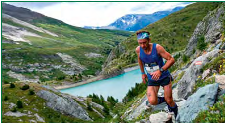
Bei der Glockner-Challenge gab ich alles

Mit einem Tiefschlag hat die Saison begonnen und mit vielen Erfolgen konnte die sportliche Rennsaison dann abgeschlossen werden. Nach einer Schulterluxation, welche ich im Jänner erlitten habe, wurde sehr fleißig und gezielt für die Erfolge gearbeitet. Stundenlanges Training, welches natürlich auch mit sehr viel Schweiß verbunden