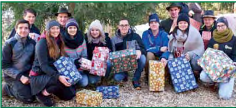
Die Burschenschaft Matschiedl freute sich über die vielen Besucher beim Adventmarkt