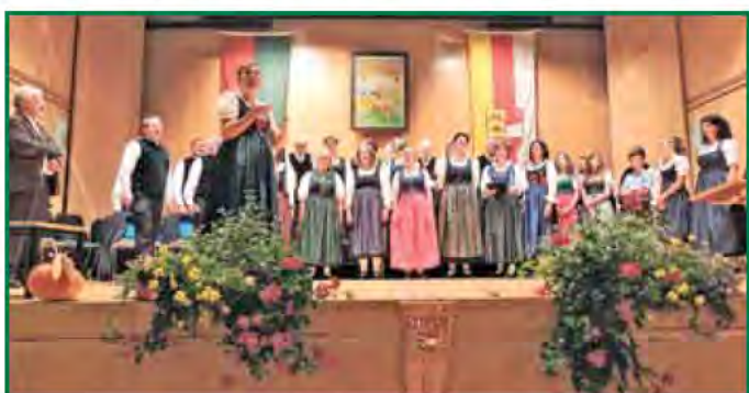
Gemeinsames Abschlusslied mit allen Akteuren beim Herbstfest