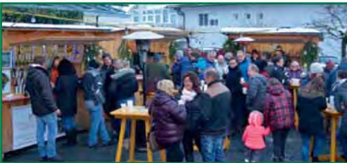
Es weihnachtete schon sehr...