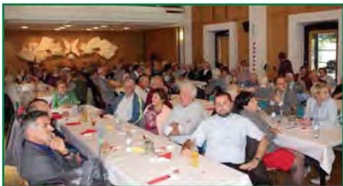
Die Seniorinnen und Senioren sind gerne der Einladung zu einem gemütlichen Nachmittag gefolgt