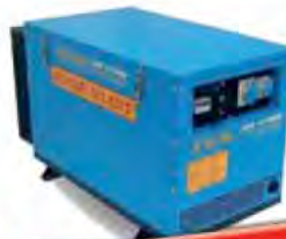
Diesel mit Schallschutz