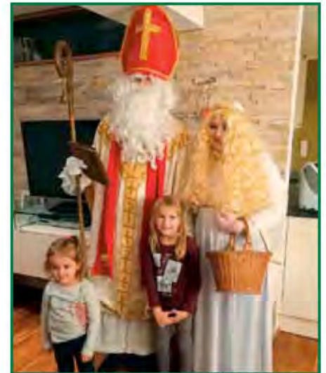
Die Aufregung war groß, als der Nikola kam

Für mich geht ein ereignisreiches und erfolgreiches Jahr zu Ende.