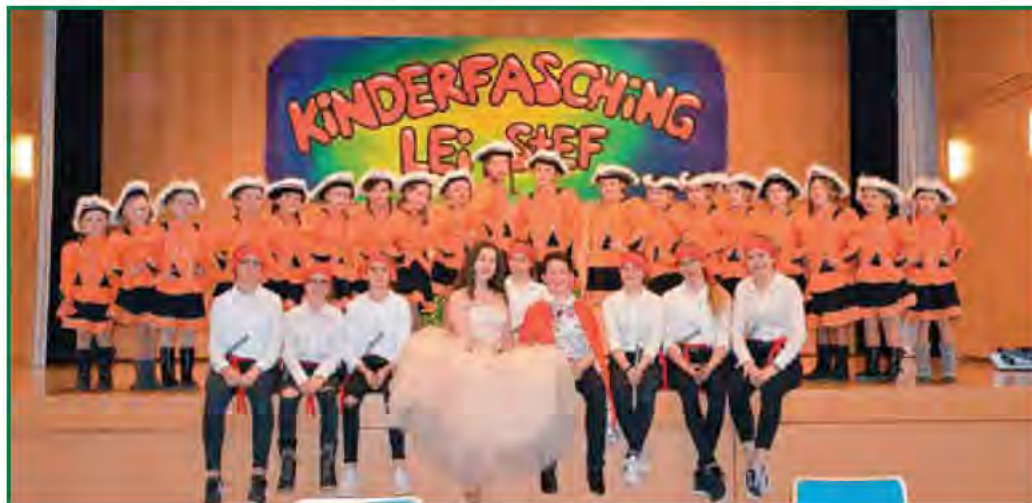
Die Faschingsgilde von 2019 – eine Einheit in Outfit und Tanz

Bewegung und Tanz Jahrelange Muster werden aufgrund des großen Erfolges des Kinderfaschings von St. Stefan beibehalten. Neu ist, dass der Weg ein neutraler und unabhängiger sein soll. So darf man gespannt sein, die Kinder in diversen Besetzungen (ev. bei der einen oder anderen Veranstaltung) in der Heimatgemeinde