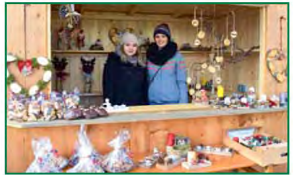
Hier konnte man selbstgemachte Adventdekorationen für zu Hause finden