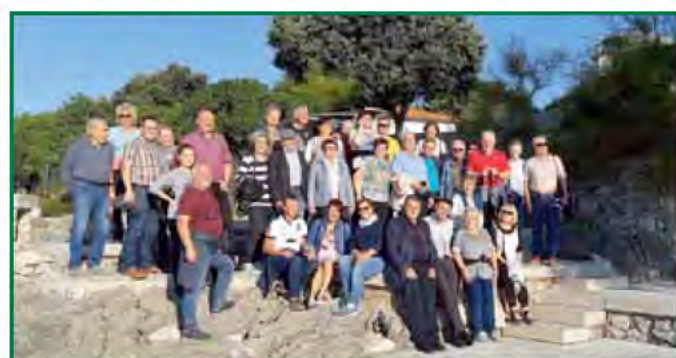
Bei allerschönstem Herbstwetter erkundeten wir die Insel Krk