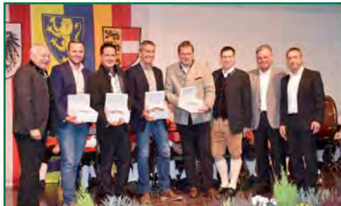
Anlässlich des 20-jährigen Jubiläums der Markterhebung der Marktgemeinde Nötsch fand ein reger Austausch unter den Bürgermeistern der Nachbargemeinden über mögliche Kooperationen statt