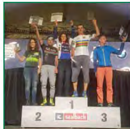
In Saalbach-Hinterglemm wurde ich Amateurvizeweltmeister im Marathon und in Sillian Vizeweltmeister am E-Bike

war, gab mir abermals recht, nicht gleich aufzugeben. Zahlreiche Podestplätze waren schlussendlich das Ergebnis. Heuer wurde das Hauptaugenmerk nicht nur auf das Biken gerichtet, sondern ich versuchte mich im Trailrunning, welches zur Zeit sehr stark boomt. Leider gibt es in näherer Umgebung wenige Trainingsstrecken und daher