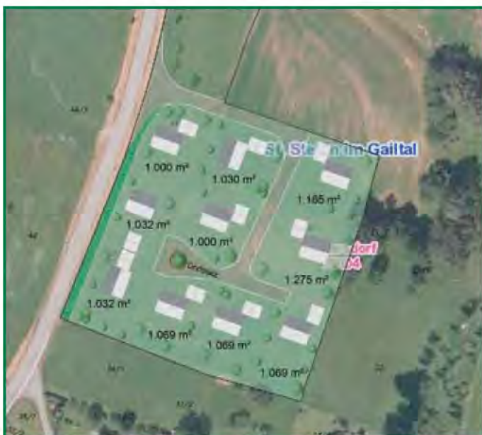
Die geplanten Baugrundstücke befinden sich nordwestlich des Ortszentrums von Hadersdorf und sind über die Landesstraße gut erreichbar (Planer: LWK Villach)