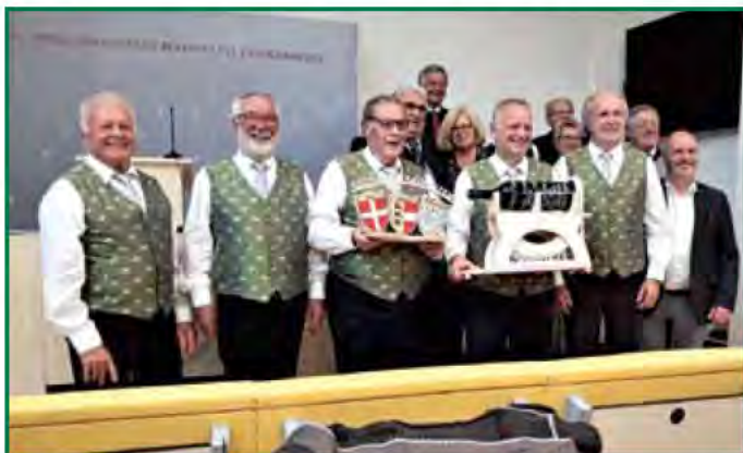
Ehrung für das Quintett Karnitzen in der Theologischen Päpstlichen Hochschule in Heiligenkreuz