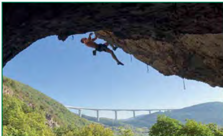
In der Route „Za stara Kolo“ in Misja Pec, SLO