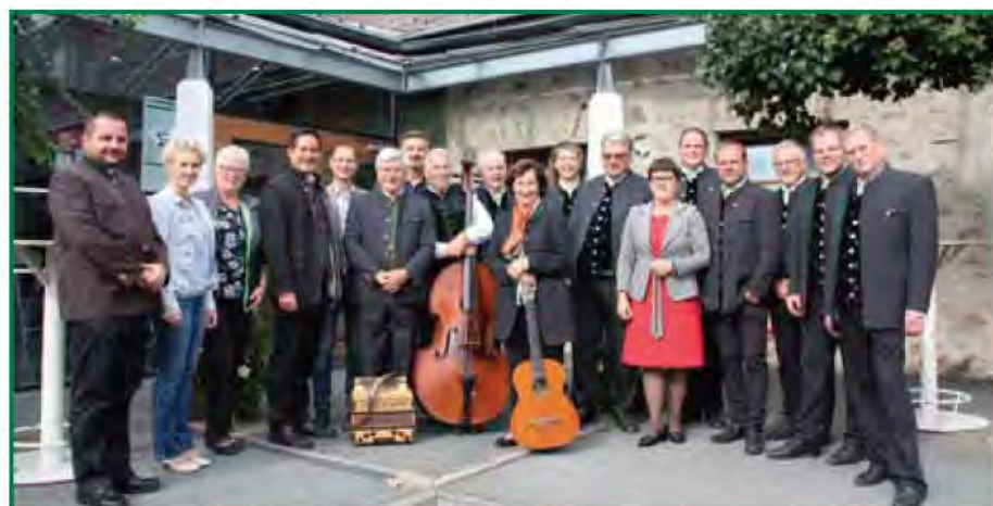
Sie alle zeigten sich für eine gelungene Veranstaltung verantwortlich