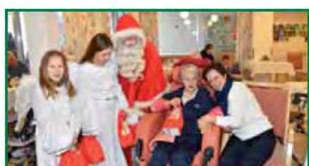
Strahlendes Leuchten in den Augen aller