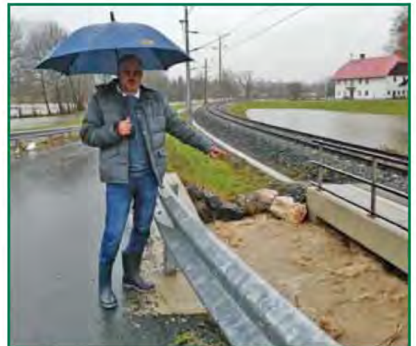
Hochwassersituation am 20. November bei der Pumpstation in Bodenhof und beim Lipschitzbach