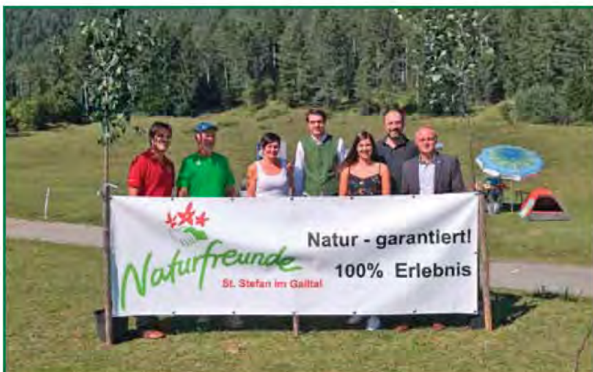
Die Naturfreunde St. Stefan feierten im September ihr 40-Jahr-Jubiläum