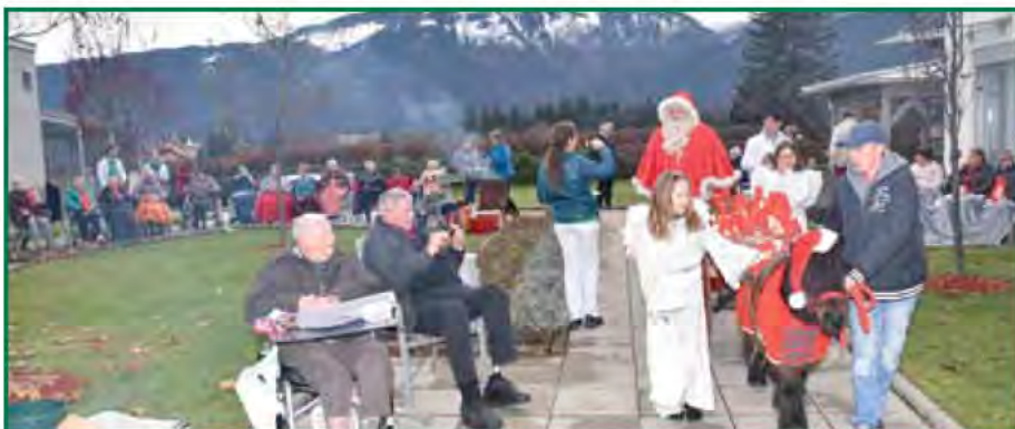
Wie jedes Jahr freuen sich die BewohnerInnen auf den Nikolo