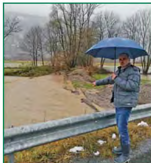
Die Wasser- und Geröllmassen des Lipschitzbaches

Als Energierreferent ist es mir in Zukunft auch wichtig, auf erneuerbare Energie zu achten. So sind z.B. die Errichtung von Photovoltaik-Anlagen oder Kleinwasserkraftwerken Ideen, die bei den näch-